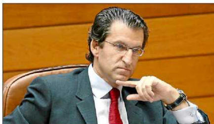
Alberto Núñez Feijóo, nuevo presidente de Galicia.

La convocatoria de empleo propuesta por la Administración regional, que pretende aumentar la estabilidad laboral y reducir las bolsas de interinidad, aún debe ser ratificada por el Consejo de Gobierno de la comunidad. PÁG. 8