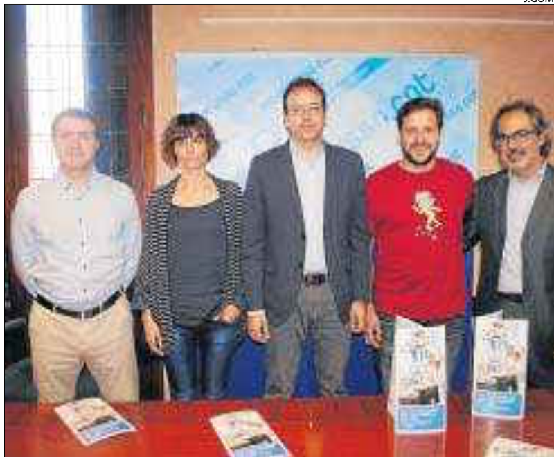
La presentación del segundo "Vi per Vida" en el consistorio.