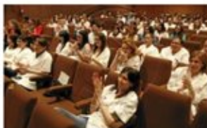
Sis especialitats de l'Arnau sense nous MIR, que prefereixen Barcelona