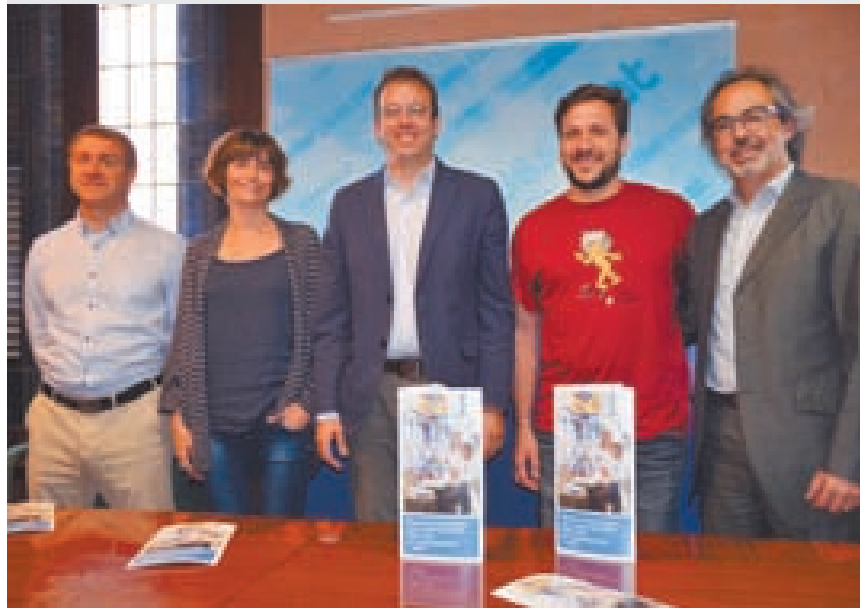
Moment de la presentació del tast solidari