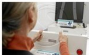
Aptes al volant malgrat l'edat