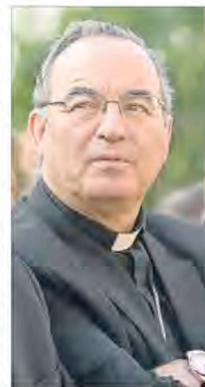
El arzobispo Jaume Pujol

H20, que agrupa al colectivo homosexual del Camp de Tarragona, acusó a Jaume Pujol de