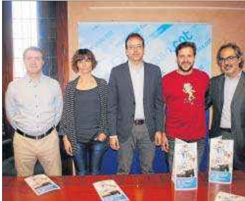
La presentación del segundo "Vi per Vida" en el consistorio.