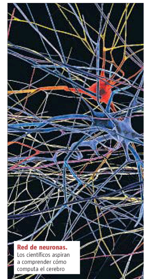
Red de neuronas. Los científicos aspiran a comprender cómo computa el cerebro