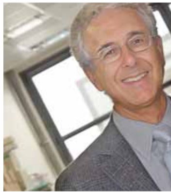
El catedrático Joan J. Guinovart (CEDIDA).

Las terapias actuales son para controlarla, pero no hay tratamientos curativos. Hoy en día conocemos mejor los factores involucrados, los mecanismos moleculares y celulares que fallan, detectamos nuevas dianas terapéuticas y se están proponiendo nuevos tratamientos de tipo farmacológico. En cuanto a la cura,