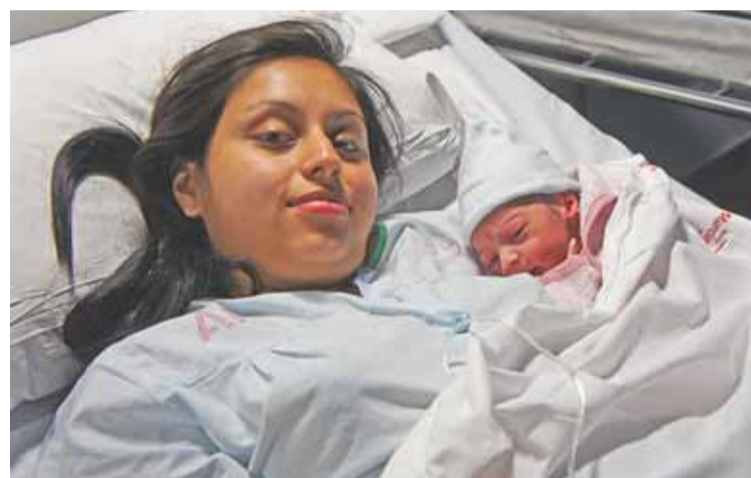
Madre e hijo permanecen juntos para un seguimiento exhaustivo de su evolución (MPPR).

ñada de su pareja o familiar; y está atendida por un equipo de profesionales que está al tanto