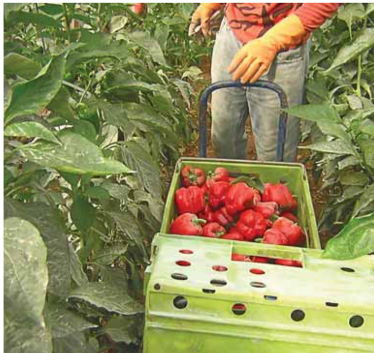
Los productos ecológicos son beneficiosos para el medio ambiente.

© Todos los alimentos ecológicos deben identificarse con las palabras ecológico, biológico u orgánico, o los términos ECO o BIO, y acompañados del logotipo europeo de la producción ecológica (un rectángulo verde con una hoja formada por estrellas). También debe aparecer el código del organismo de control que certifica el alimento (por ejemplo ES-ECO-024-MU) y justo debajo el origen de las materias primas. También puede llevar el logotipo del organismo de control que los certifica (CAERM).