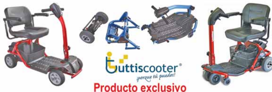
La firma, ubicada en Cartagena, ofrece productos exclusivos con total garantía.

Pida su demostración gratuita del producto que necesite. Las instalaciones de Tuttiscooter se encuentran en la calle Alfonso X, el sabio, nº 6, de Cartagena, y sus teléfonos son: 968 957 795 y 616 566 981 . También puede ver la página www.tuttiscooter.com o resolver sus dudas enviando su mensaje al correo electrónico info@tuttiscooter.com .