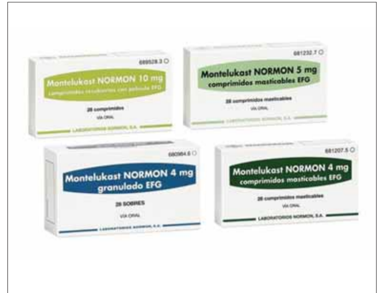
Se comercializa en comprimidos recubiertos, comprimidos masticables y sobres

El producto se vende en comprimidos recubiertos, comprimidos masticables y sobres.