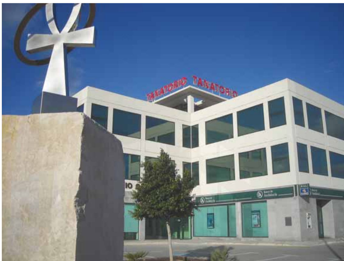
Exterior del Tanatorio y Funeraria Oeste ubicado en (FOTOGRAFÍA CEDIDA POR SERVICIOS FUNERARIOS OESTE).

Este contrato de asistencia funeraria se actualiza anualmente con un 5 por ciento del impor-