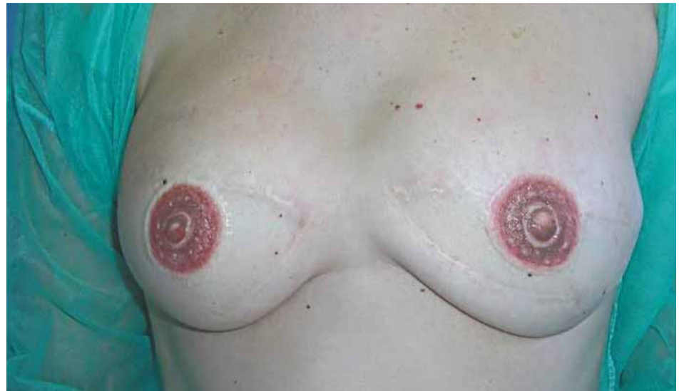
A la izquierda, el pecho de una mujer antes del tratamiento de micropigmentación en las areolas mamarias. A la derecha, la misma paciente tras el proceso de pigmentación.