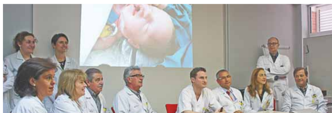
Parte del equipo que atendió a la niña que tenía un tumor facial que amenazaba con asfixiarla durante el parto.