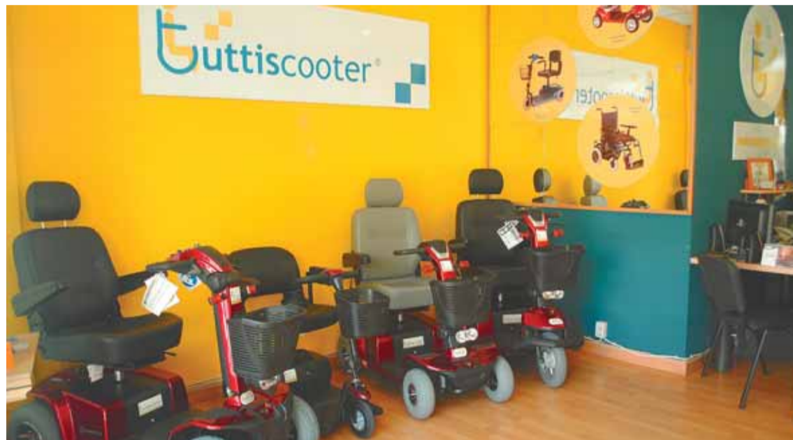
Tuttiscooter recoge el producto de cualquier marca y se lo devuelve totalmente reparado