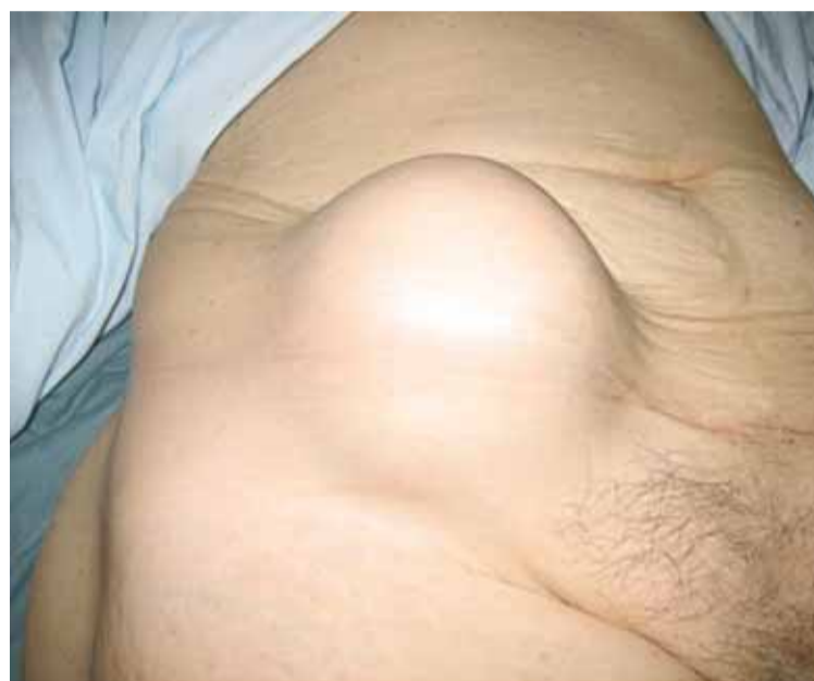
Imagen de una avanzada hernia que debe ser operada cuanto antes.

No hay un límite de edad para operarse, según indican los especialistas, porque los riesgos, tanto en cirugía como en anestesia, son tan bajos que prácticamente no hay contraindicaciones. Lo que sí puede resultar peligroso es operarse ya en urgencias porque la hernia se ha complicado.