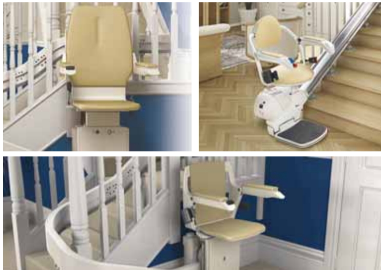
Prototipos de asientos que se desplazan para poder subir las escaleras (VALERA).

Sin embargo, en el mercado encontramos aparatos que salvan esos obstáculos y ayudan a moverse con independencia. Este es el caso de las sillas salvaescaleras, una de las opciones más versátiles en cuanto a instalación y con un coste mucho menor que otras soluciones.