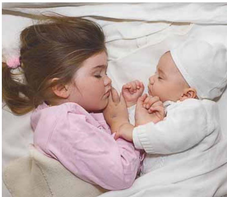
La web proporciona información detallada en torno al trastorno en los niños (AGENCIA).

La web www.mojarlacama.es informa a través de expertos