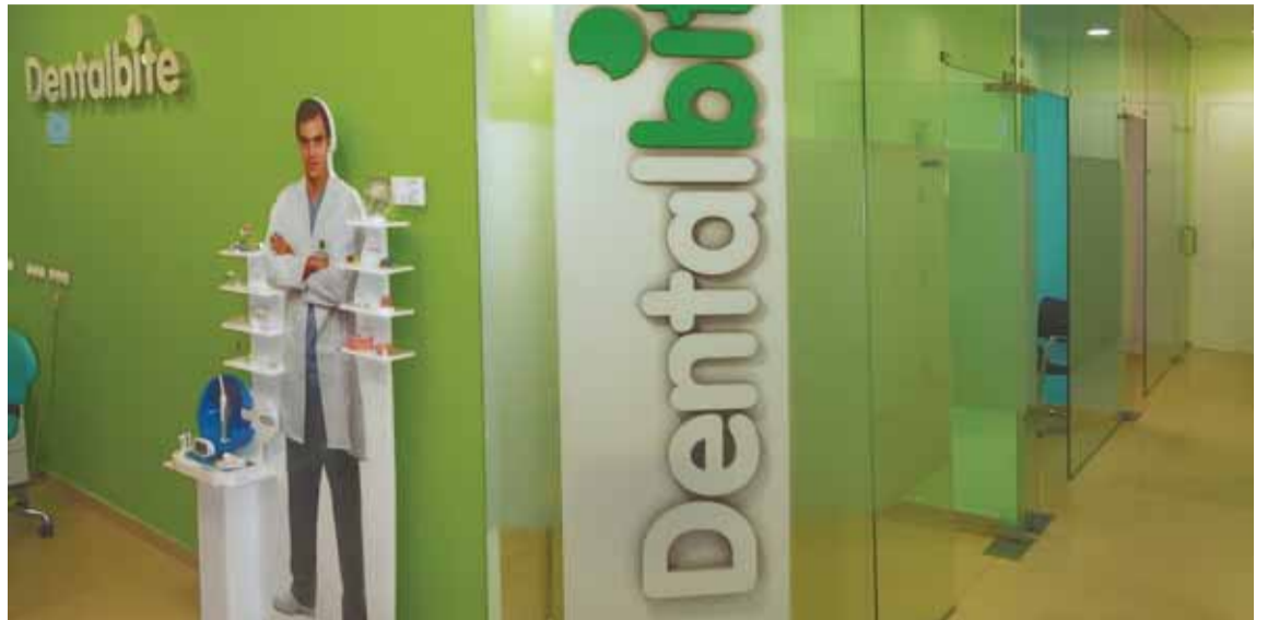
Aspecto parcial de la recepción de la clínica Dentalbite ubicada en la Nueva Condomina de Murcia.