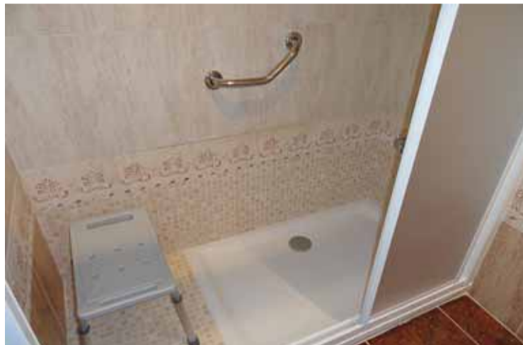
Ducha después de una reforma en el cuarto de baño de un particular (MASDUCHA).

Para MasDucha cada detalle de la instalación del pie de ducha es importante. Utilizan los mejores materiales y accesorios de las primeras marcas del sector, tales como el plato de ducha