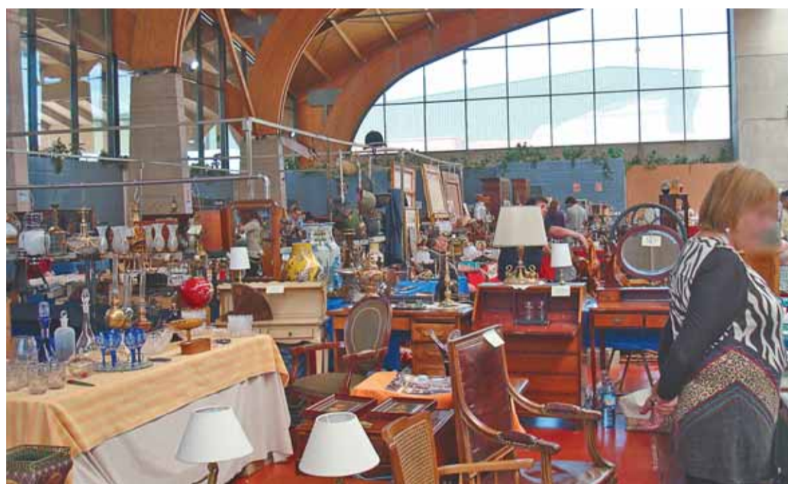
El primer desembalaje de antigüedades contará con 30 expositores de diferentes provincias.

El primer desembalaje de antigüedades, organizado por la empresa Nougrupfiral , le invita