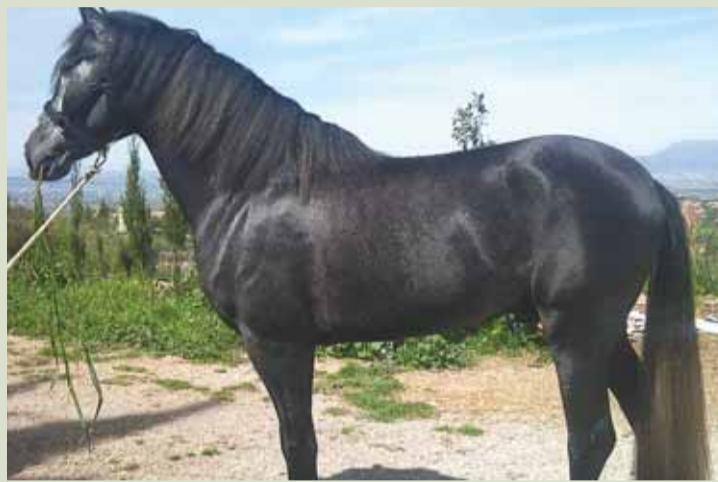
La carne de equino sigue un procesos de control muy específico y estricto