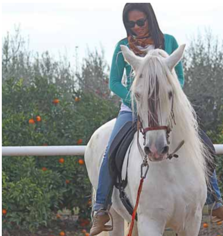
Los caballos para exhibiciones no son consumidos por el hombre.

Las autoridades sanitarias insisten en que se trata de un fraude porque no se informó en el etiquetado, pero no hay riesgo para la salud. "Hasta mediados de abril no sabremos la envergadura real del problema. No existe ningún riesgo en el consumo de carne de caballo, ya que este producto está regulado por una normativa veterinaria europea, como cualquier otra carne. La cuestión radica en los fallos hallados en el etiquetado del producto. Cualquier alimento debe llevar una especificación de lo que contiene. Por ello, la Comisión Europea ha puesto en marcha un programa de control