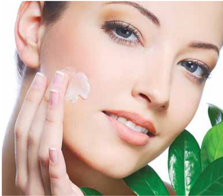
Es recomendable que use productos cosméticos hipoalergénicos.

A los factores genéticos y personales que ya se conocían, los médicos apuntan actual-