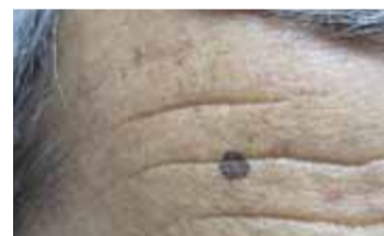
Diferentes lesiones pigmentarias (HM).