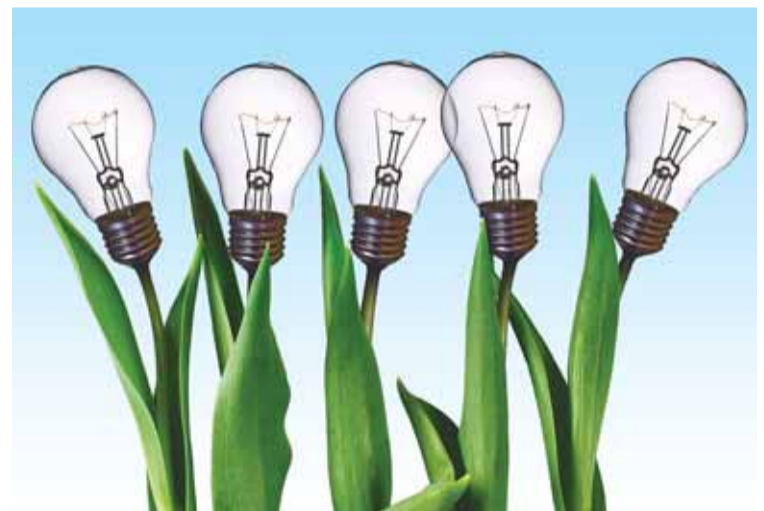
Los productos Green Space reducen el consumo y son respetuosos con el ambiente.

Entre otros, Green Space cuenta con equipos solares térmicos de última generación, instalaciones eléctricas autónomas,