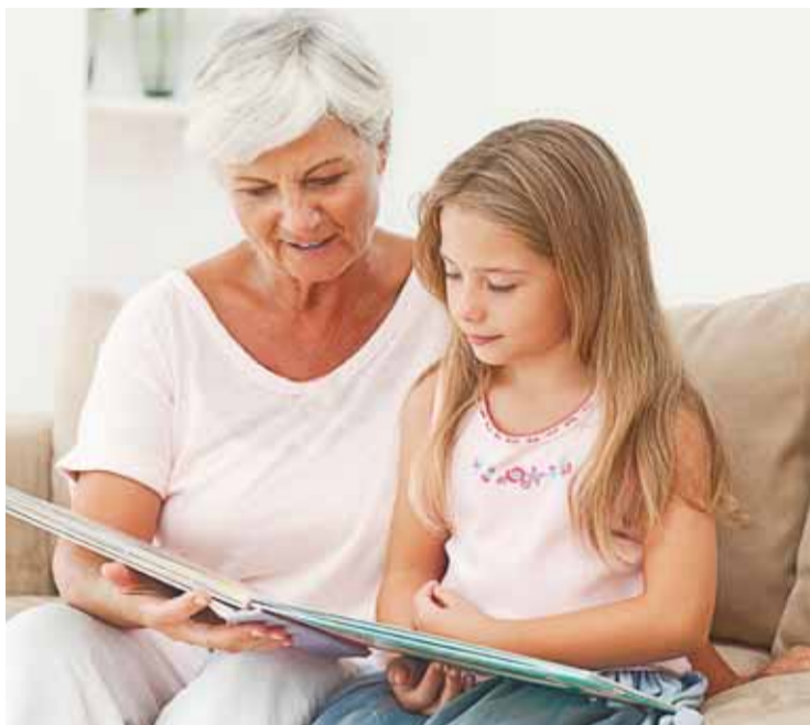
Con la vista cansada las personas de edad tienen dificultades para ver de cerca (S21).

¿Qué se puede hacer para combatir la presbicia? Hasta ahora la única manera de corregir el problema era el uso de lentes para ver de cerca.