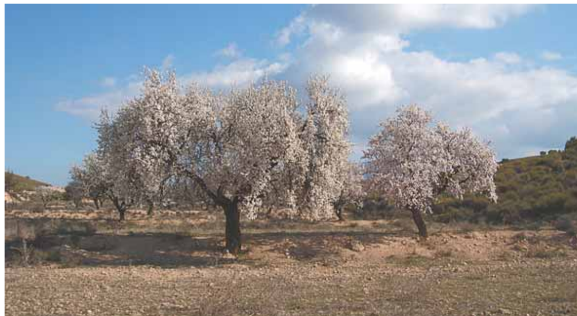
Los cultivos ecológicos están libres de sustancias químicas lo que evita la contaminación.

En el ámbito de la producción vegetal, nuestra Región goza de muy 'buena salud'. Somos la primera Comunidad en porcentaje de agricultura ecológica cultivada frente a la super-