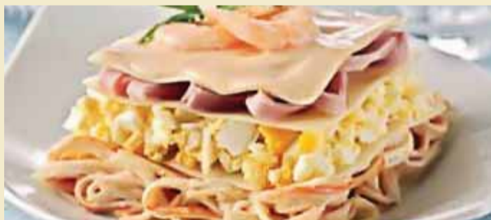
Debe dejar la lasaña en la nevera media hora para que tome consistencia (S21).