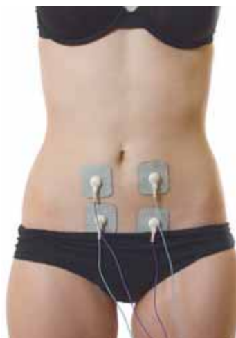
ADMENS alivia los dolores menstruales

Es un concepto innovador para aliviar el dolor e incluye unas aplicaciones específicas que aceleran la recuperación de la lesión, a la vez que actúa como una infiltración de efecto anestésico; así,