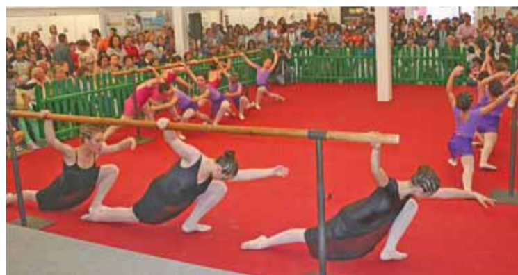
Exhibición de danza durante la Semana de la Salud de Molina en 2012.

siete días diferentes actividades divulgativas y, además, se organiza la feria de la salud con la colocación de stands de empresas y asociaciones. Su horario será 10:00 a 13:30 horas y 18:00 a 21:00 horas, de jueves a sábado.